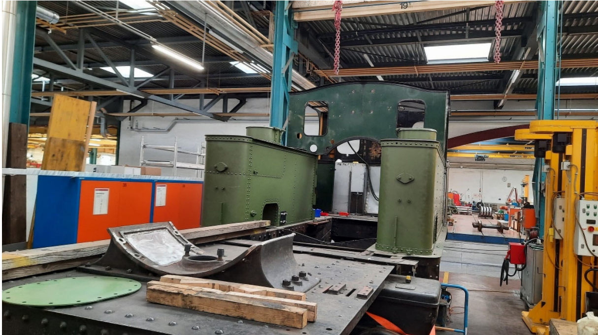
Türe und Handgriffe werden angepasst

Die Lok von vorne mit aufgesetztem Wasserkasten und Führerhaus