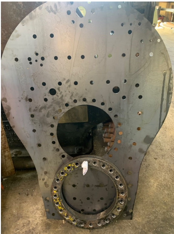
Die Rückwand mit dem fertigen Feuerbüchsring