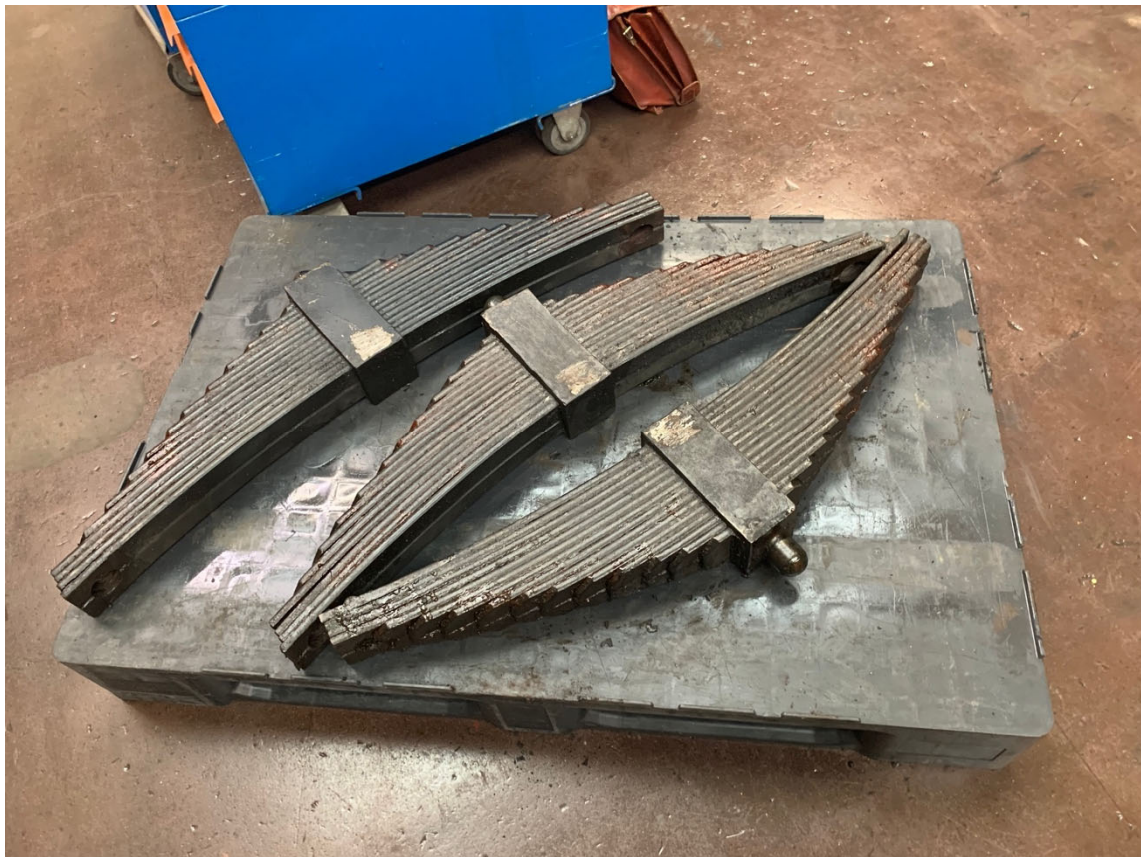
Die Teile für die Federaufhängung sehen leider nicht gut aus